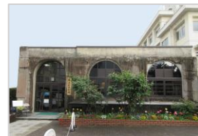
本川小学校平和資料館